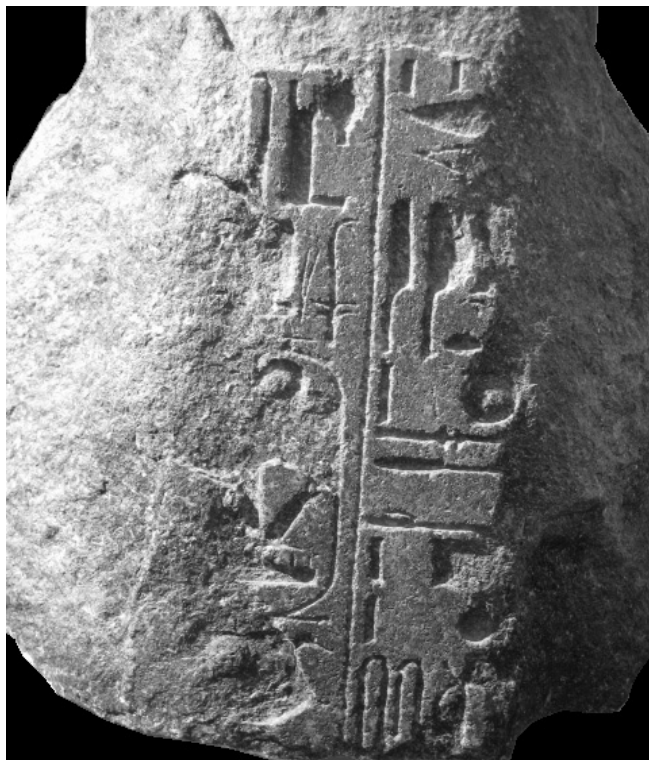
Fig. 3: Abbazia di Grottaferrata: la statua di Sethi I, retro.