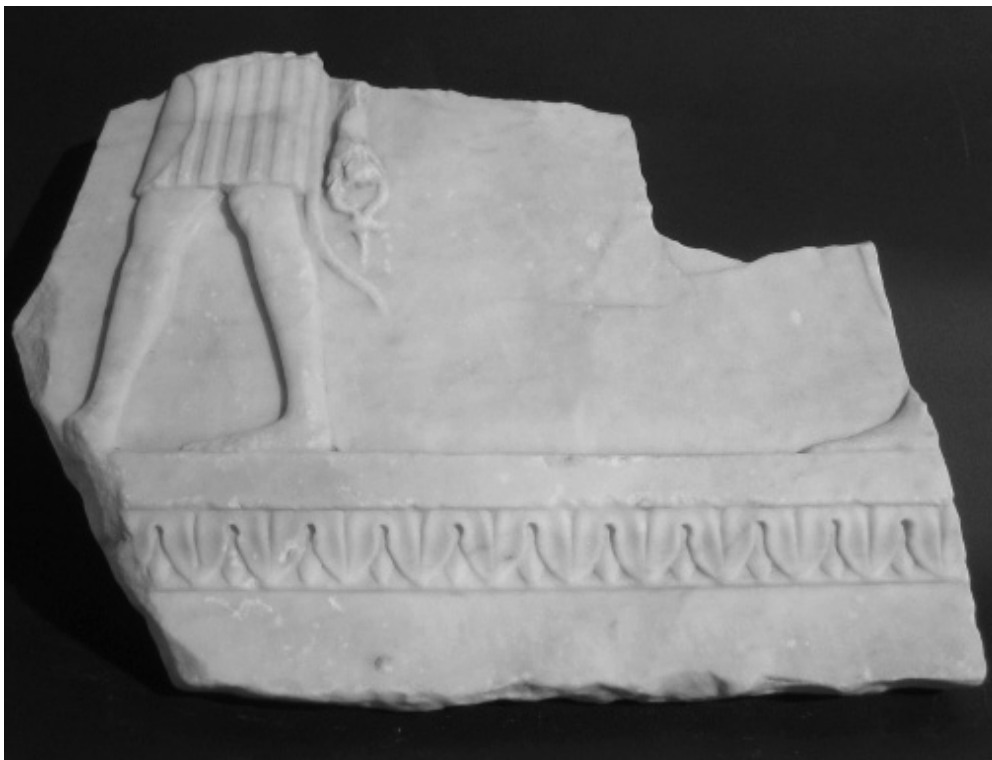
Fig. 1: Abbazia di Grottaferrata: uno dei tre frammenti di rilievo egittizzante in marmo.