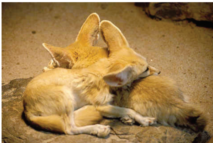
Fig. 2. Photographie en pied de fennecs.

sur une photographie en pied de deux fennecs [fig. 2], principalement celui situé au premier plan, et d'un oryctérope [fig. 3].