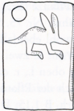
Fig. 1. Étiquette en ivoire découverte dans la tombe du roi scorpion (d'après G. Dreyer, 1998, p. 122 [81]).

IL Y A UNE DIZAINE d'années, une représentation prédynastique fut déterminée comme étant celle d'un oryctérope par G. Dreyer 1 . Il s'agit d'une gravure de très petite dimension puisqu'elle a pour support une étiquette en ivoire de 1,6 cm de haut, étiquette originellement reliée à une jarre de type WW 2 provenant de la nécropole U d'Abydos, plus précisément de la tombe du roi Scorpion I (U-j), datée du début de Nagada IIIa 3 [fig. 1].