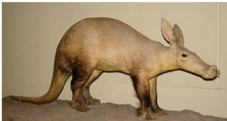
Fig. 3. Photographie en pied d'oryctérope.

Les particularités physiques de l'animal de l'étiquette pouvant s'apparenter à celles d'un oryctérope sont moins nombreuses mais tout aussi troublantes. La première tient dans sa queue relativement longue mais surtout large à la base et pointue à l'extrémité, alors que la queue du fennec présente un profil inverse (ténue à la base et s'ébouriffant vers l'extrémité). La seconde tient dans la forme des pavillons auriculaires qui ressemblent bien plus à ceux d'un oryctérope puisqu'ils présentent en commun avec ce dernier un étranglement à la base suivi d'un élargissement (particularités très visibles sur le pavillon droit de l'animal de l'étiquette), alors que chez le fennec cet étranglement n'existe pas. La troisième est l'absence de cou chez l'animal énigmatique, qui est plus une caractéristique d'oryctérope que de fennec. La quatrième et dernière consiste en l'absence de chanfrein nasal chez l'animal de l'étiquette, lui donnant un profil quasi rectiligne du front jusqu'au museau, profil que l'on retrouve chez l'oryctérope mais pas chez le fennec, qui, comme tous les canidés, présente une nette rupture de profil entre le front et les naseaux. Ces derniers points de comparaison suggèrent que G. Dreyer n'est peut-être pas dans le faux lorsqu'il voit dans l'animal énigmatique un oryctérope.