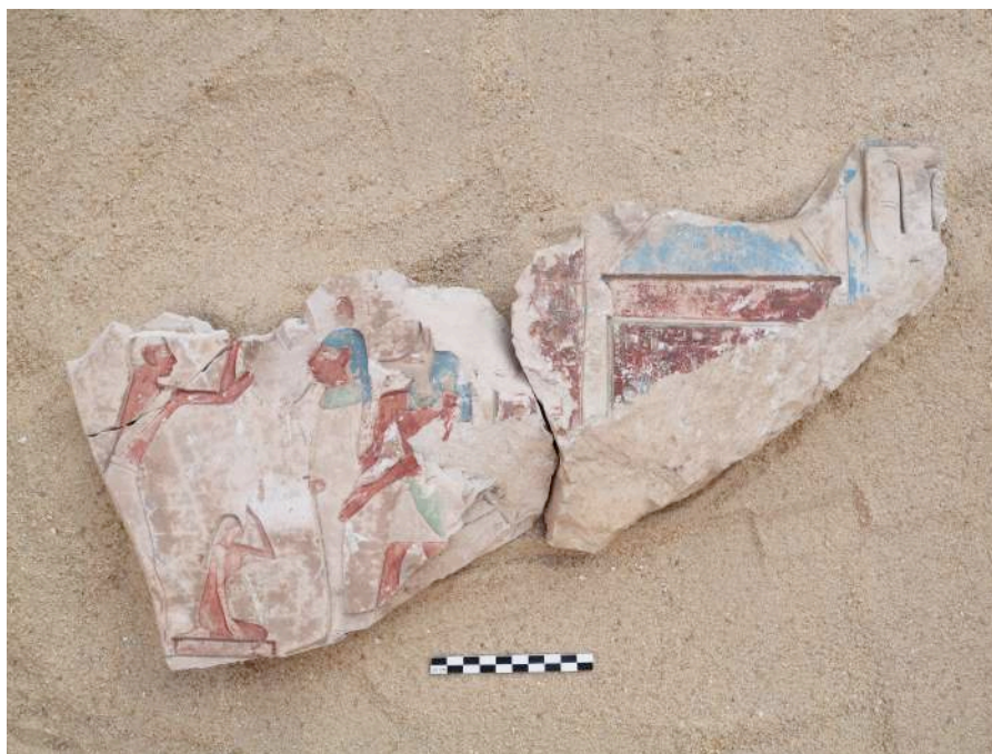
Fig. 3. TT 33 : détail de la vignette du LdM 1.

Puisque les trois fragments décorés ont été trouvés dans le secteur de fouille « B » (US 8), entre le premier et le deuxième pilier de la rangée sud [fig. 2], il est vraisemblable qu'une fois tombés, ils soient restés sur le sol à proximité de leur emplacement d'origine dans cette partie du mur.