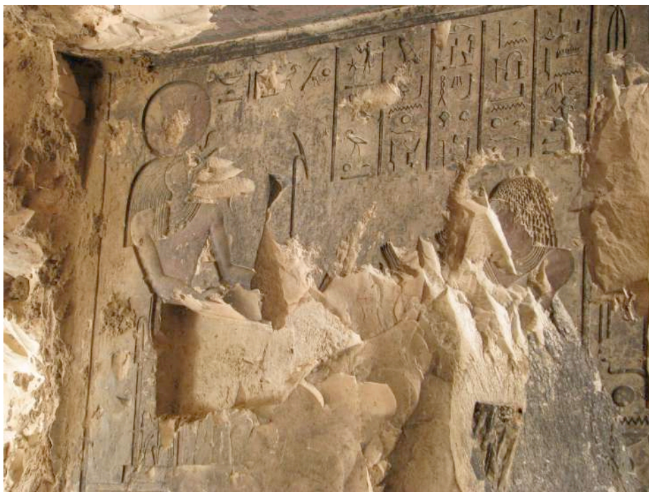
Fig. 4. TT 33 : détail de la vignette du LdM 15.

du passage entre le porche d'entrée et la première salle hypostyle (LdM 15a-b-[c-d ?]-e-f) 15 . Dans les deux cas, le texte est accompagné de la vignette avec Padiaménopé agenouillé vers l'extérieur de la tombe (est), en adoration devant la figure intronisée de Rê-Horakhty [fig. 4]. La présence de ce texte et de la scène associée sur la paroi sud de la salle I représenterait donc une répétition, à peu de distance de la première attestation.