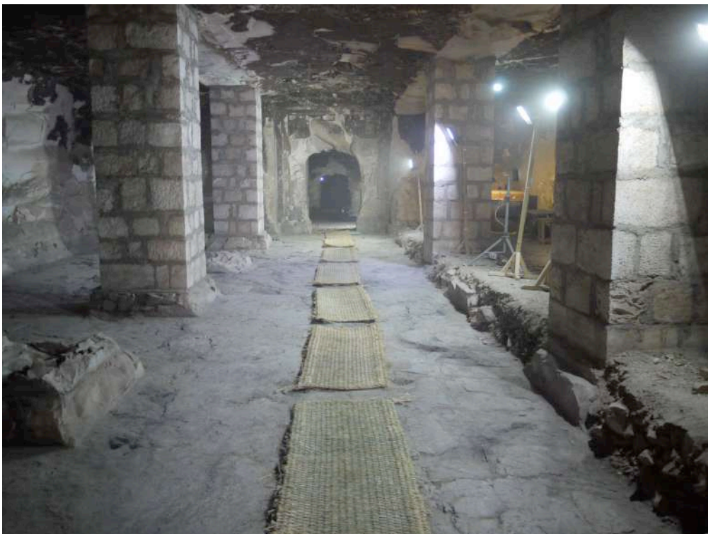
Fig. 1. TT 33 : vue de la salle I, partiellement dégagée.

A U COURS de la campagne de l'automne 2021 de la mission française dans la tombe de Padiaménopé (TT 33) se sont poursuivies, sous la direction de S. Nannucci, les fouilles dans la première salle hypostyle de l'hypogée. Cette grande pièce (16,20 x 10,90 m) qui jouxte le porche d'entrée, était autrefois caractérisée par la présence de huit piliers carrés (tous effondrés) la divisant en trois nefs. Quatre de ces piliers ont été reconstruits à l'époque moderne pour des raisons statiques, tandis que des autres, il ne reste que les bases [fig. 1].