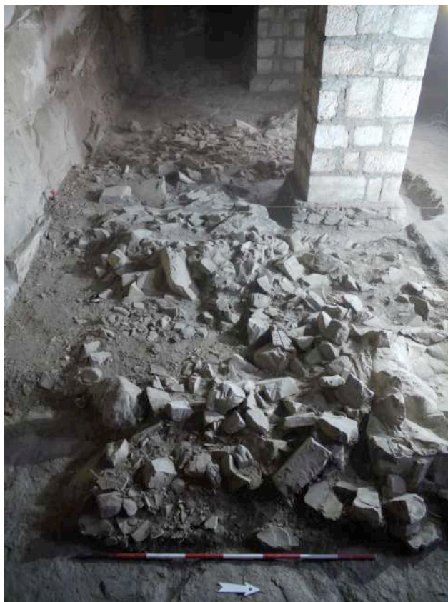
Fig. 2. TT 33 : vue du secteur B de la fouille.

étable/écurie et bivouac 1 . Dans les couches investiguées, ont été trouvés des milliers de fragments de calcaire, avec inscriptions en hiéroglyphes et scènes, faisant partie de l'ancien décor de la tombe. La plupart de ces blocs proviennent des piliers, des murs et du plafond de la pièce, mais il y en a aussi certains qu'on peut attribuer aux parois du porche d'entrée.