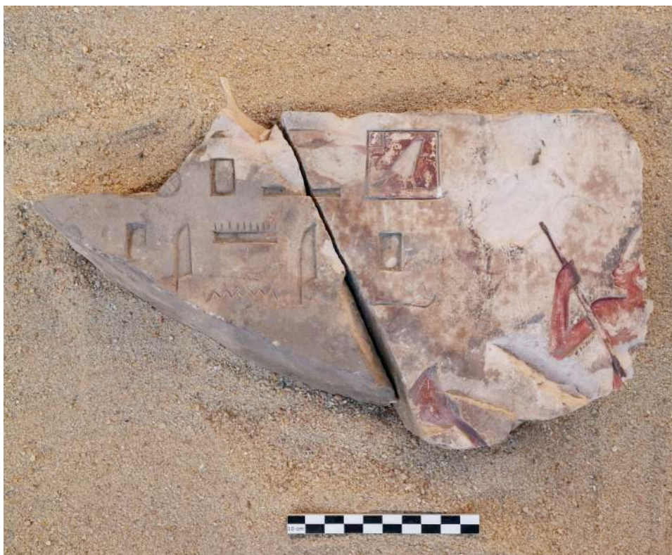
Fig. 5. TT 33 : détail de la vignette du LdM 17.

Sur le bloc I_00503 [fig. 5], on voit en effet la proue d'une barque avec un rameur portant la couronne blanche de Haute-Égypte et, juste devant, le nom de Padiaménopé avec l'un de ses titres :