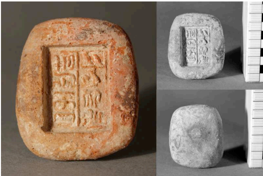
Abb. 1a-c. Der Model für das Revers einer Siegelplakette BoS GV 048.

Die Bonner Form entspricht den Modellen für ornamentale und figürliche Fayencen aus Qantir in Form und Machart. 5 In der Sammlung Khawam befinden sich drei vergleichbare open-face -Model für die Vorder- und Rückseiten von rechteckigen Plaketten: der Model für eine Vorderseite (Avers) zeigt einen Adoranten vor dem Thronnamen Ramses' II., das für die Rückseite (Revers) enthält – wie das Bonner Stück – zwei Kolumnen Text für eine elitäre Titel- und Namenssignatur. Die dritte Form zeigt Hathor-Nebet-Hetepet vor dem Geburtsnamen Ramses' II. 6 Ein mit diesem identisches Model wurde von Mahmoud Hamza in Qantir gefunden, so dass die schon angenommene Herkunft solcher spezifischer Formen für Fayencen auch archäologisch Bestätigung erhält. 7 Dem publizierten Korpus der Model für rechteckige Siegelplaketten gehören noch zwei letzte Formen mit dem Motiv einer Sistrum spielenden šm .yt Nfr.t-jry an . 8