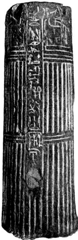
Abb. 2. Die Säule Berlin ÄM 1446 (nach Borchardt, Die aegyptische Pflanzensäule. Ein Kapitel zur Geschichte des Pflanzenornaments , Berlin, 1897, 50, Abb. 80).