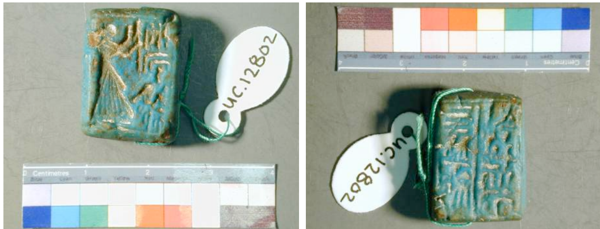
Abb. 4a-b. Die Siegelplakette London UC18102.

Die Lesung der Titel auf der Plakette ist nicht trivial, jedoch über Parallelen gut zu belegen. Die Lesung des Namens wird dadurch erschwert, dass das Zeichen Gardiner Sign-list Z7 wenig bis keine Binnenstruktur hat, sondern nur als runder Eindruck erscheint, den man auch als X1 deuten könnte. Die Kongruenz der Titel mit der Pflanzensäule in Berlin ist offensichtlich, einzig der Titel des Schatzhaus- oder Domänenvorstehers auf Seite B ist nicht unanfechtbar zu identifizieren. 30 Die Disposition der Zeichen und das Layout des Textes sprechen für eine Lesung als jm.j-r'-pr-n-nb-t3.wj . Damit ließe sich eine Brücke zum Ntr.wj-ms des Grabes Bubasteion I.16 schlagen, ist dieser doch dort als jm.j-r'-pr-wr-n-nsw mit einem Titel von gleichem inhaltlichen Bezug ausgestattet, der Domänenverwaltung des Königs. Allerdings mag man – gerade unter den Voraussetzungen der schlechten Qualität der hieroglyphischen Zeichen auf der Plakette – auf ihrer Seite B auch den um n-nb-t3.wj erweiterten Titel des Schatzhausvorstehers lesen. Da dieser auf Seite A jedoch bereits in seiner Kurzform jm.j-r'-pr-hd vorkommt, braucht an der Identität mit dem Ntr.wj-ms der Berliner Pflanzensäule nicht zu zweifeln sein.